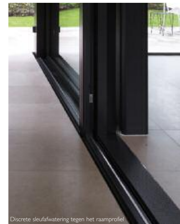
Discrete sleufafwatering tegen het raamprofiel

In de lange gang, die over de hele lengte van het verdiep loopt, wordt duidelijk wat Sofie bedoelt met het consequent gebruik van verlichting. In de gehele lengte zien we lijnverlichting, in zwarte